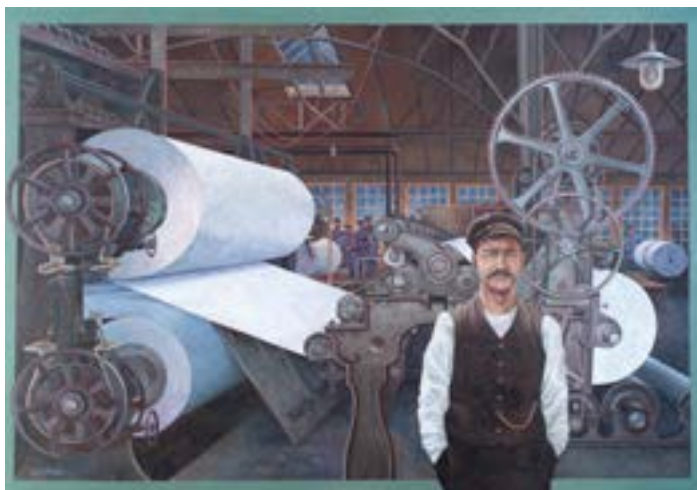
Omslagsbild till avd. 50s jubileumsbok