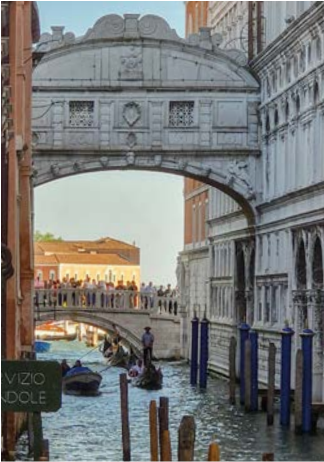
Ponte dei Sospiri, Suckarnas bro. En gångbro från domstolen i Dogepalatset till fängelset Blykamrarna.