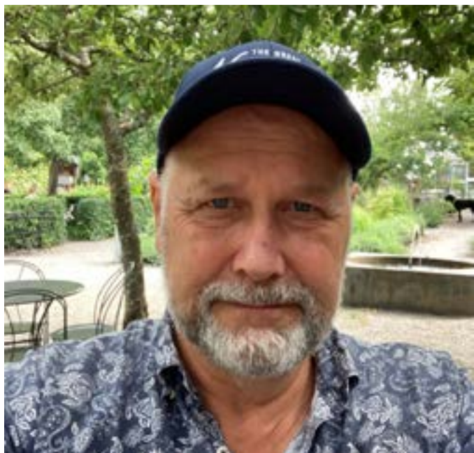
Jonas Sjöstedt - EU ska inte vara en union för strejkbrytare.