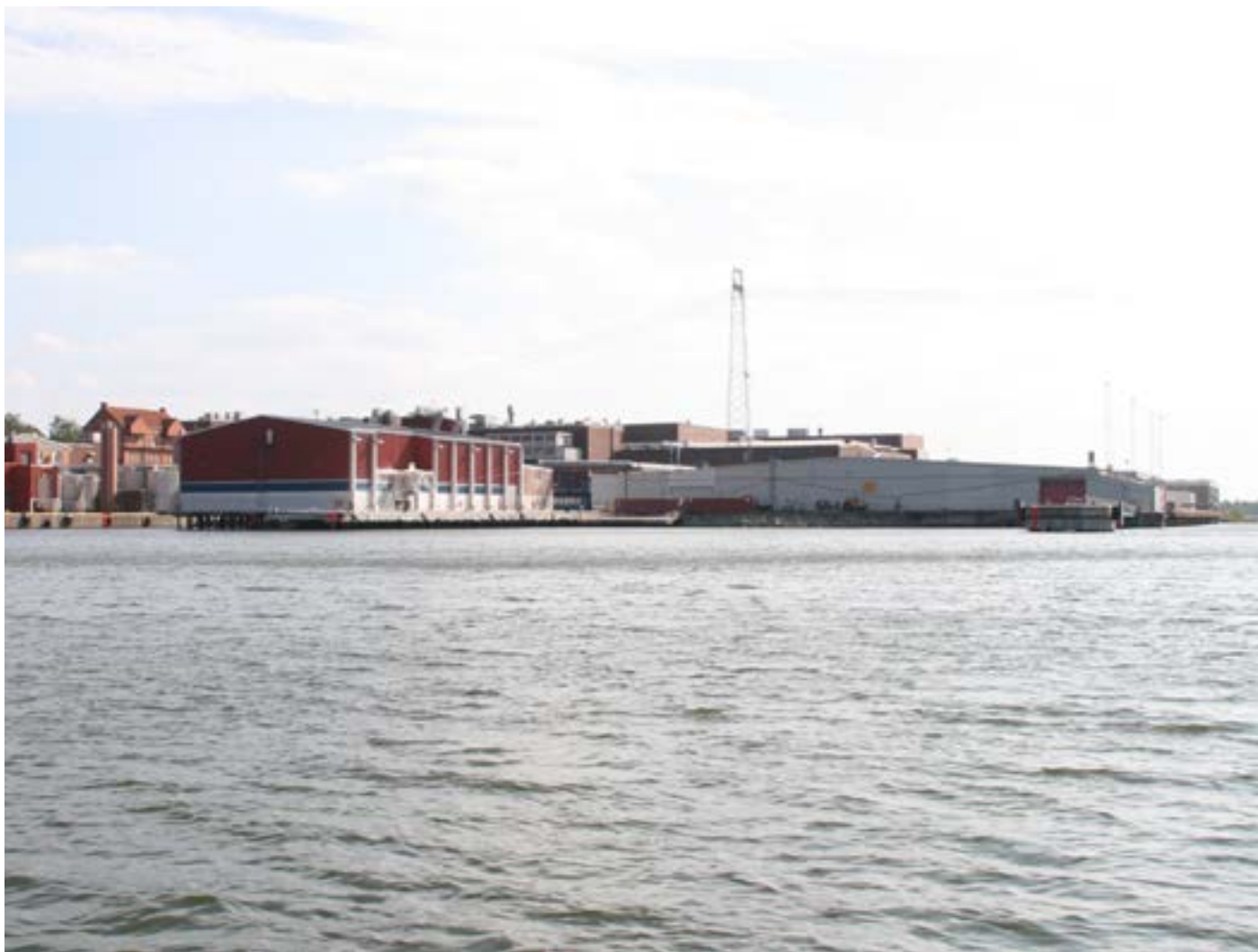
På bilden syns en del av gamla kajen längst till vänster och den nya med en ro-ro ramp längst till höger. Byggnaden i mitten är leramagasinet.