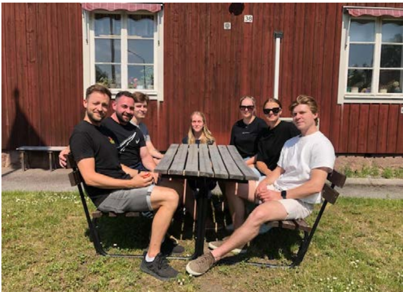
Unggruppen utanför avdelningens expedition

N u är sommaren över och de allra flesta har kommit tillbaka från semestern.