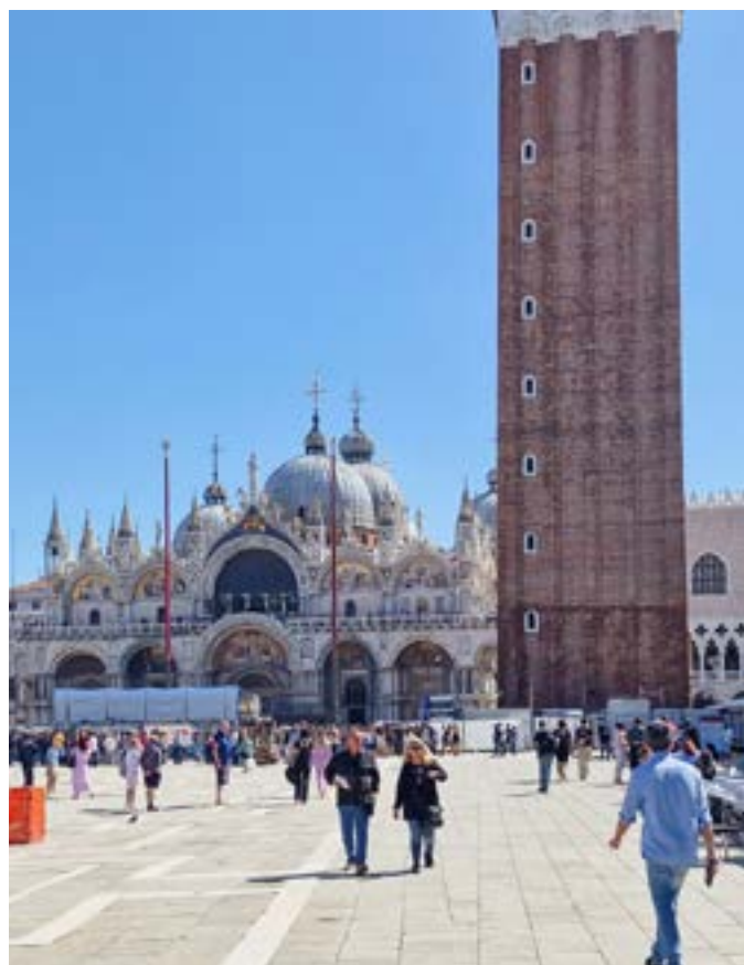
Markuskyrkan med Markusplatsen