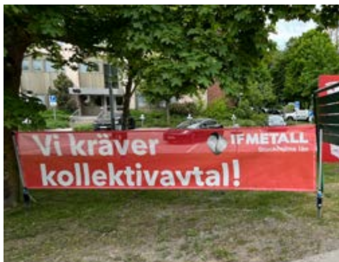
Ett tydligt krav från facket värd kampen!