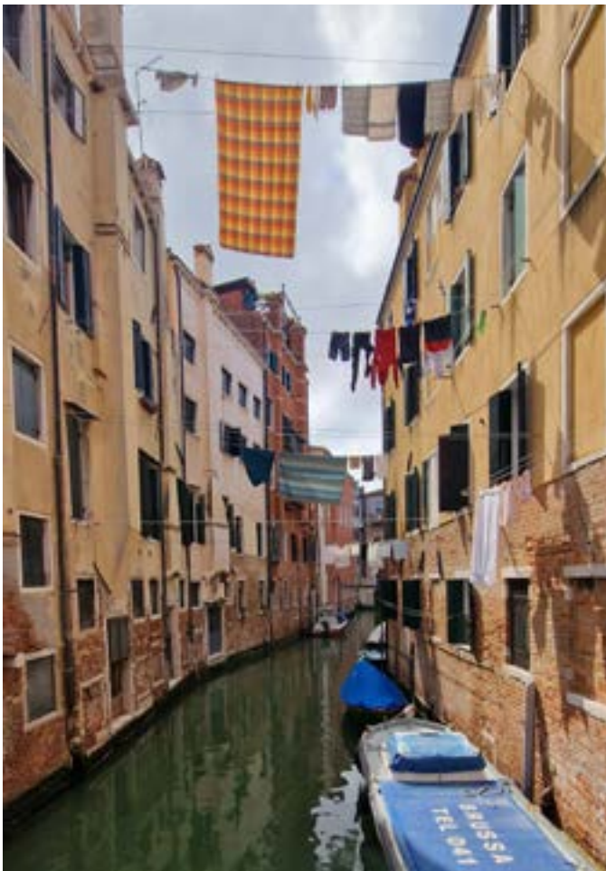
Kan det bli mer italienskt?