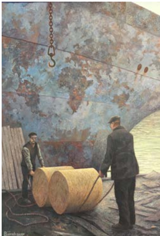
Avdeiningens tavla av Anders Björnhager.