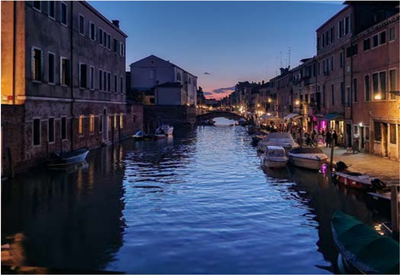
Kväll i Venedig nära vårt boende.