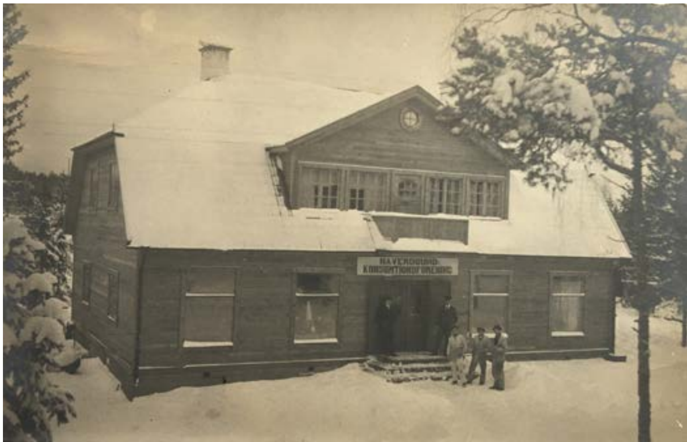
Det äldsta vykortet. Taget i februari 1916 när huset just blivit klart och skylten med Häverösunds konsumtionsförening hängts upp ovanför entrén. Troligtvis är det delar av byggnadskommittén och styrelsen som poserar framför nybygget. I övrigt verkar det tomt i affären och lägenheten.