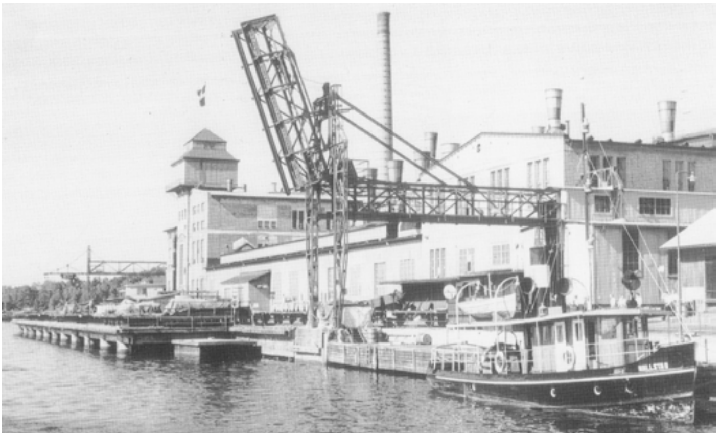
Hamnen år 1953 med bogserbåten Hallsta II.