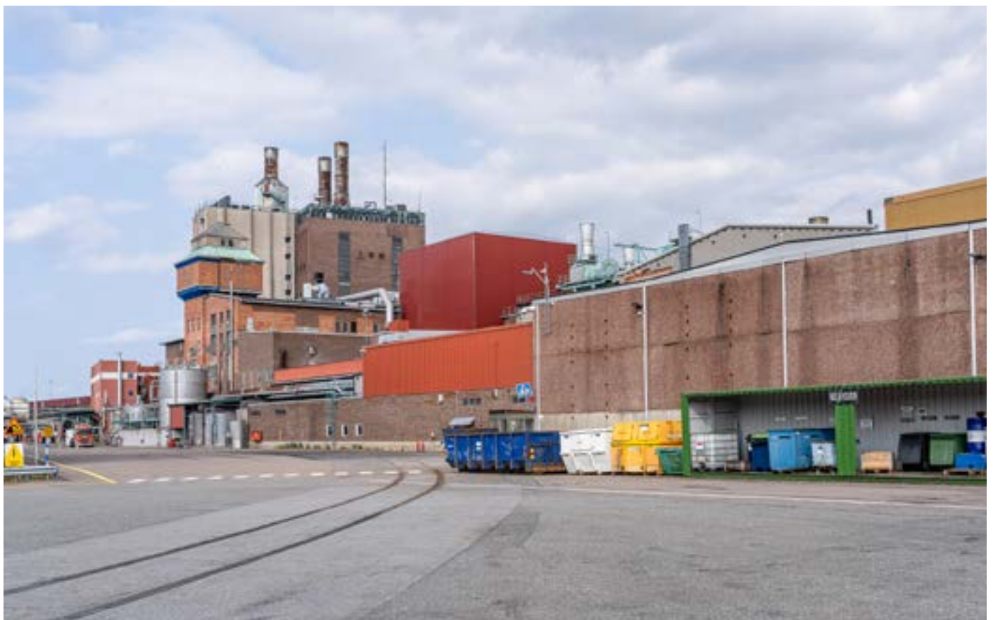
Samma plats som ovan men år 2024. Området är utfyllt och utbyggt, det gamla finns kvar men är omgärdat av nya byggnader.