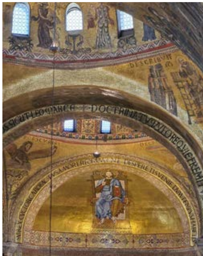
Guldmålningar i alla tak i Markuskyrkan. Imponerande!