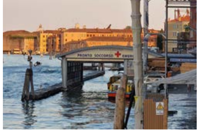
I en stad där gatorna består av vatten kommer man naturligtvis till akutintaget på sjukhuset också via sjövägen.