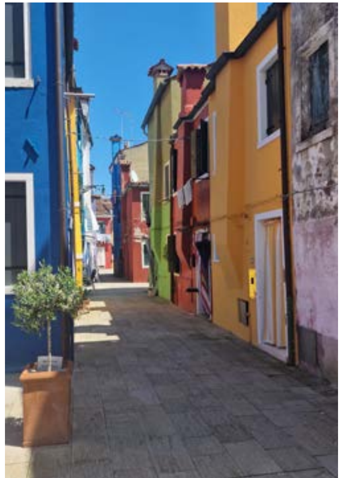
En gata i Burano som är känt för sina färgglada hus.