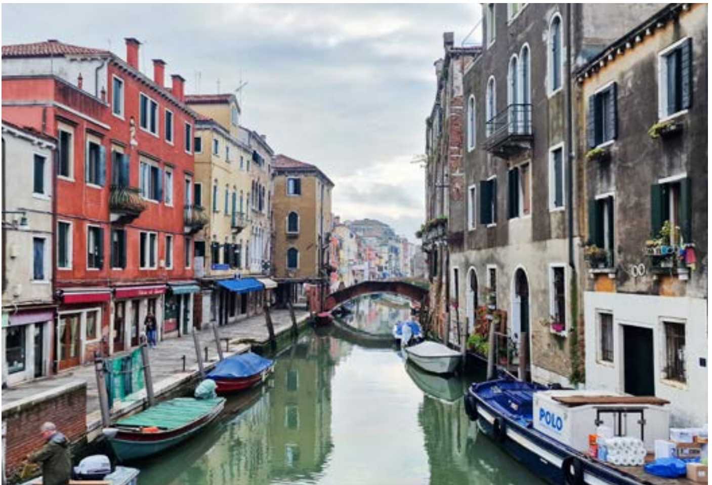
En av Venedigs många vackra kanaler