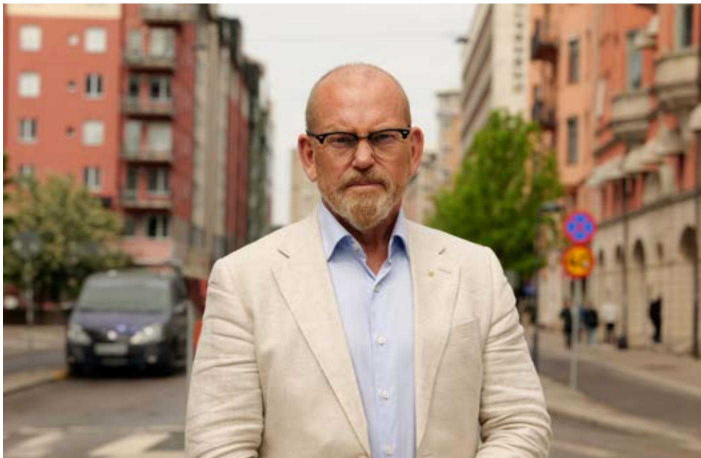
Johan Lindholm - LO ordförande sen 18 maj 2024

Vet ni? Min första sejour i Hallstavik var när jag i mitt forna jag som timmerman formade och gjöt fundament till maskinerna inne på bruket. En härlig tid! Jag hoppas även framgent kunna komma och hälsa på er i Hallsta, för vet ni en sak? Jag tänker hämta kraften från medlemmarna i Pappers och alla LO-förbund. Det är er jag pratar för, det är från er mitt uppdrag kommer.