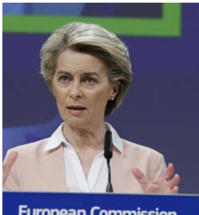
EU-kommissionens ordförande, Ursula von der Leyen

Ministrar från regeringen kallas ofta till riksdagens utskott för överläggningar. Vid en överläggning redovisar