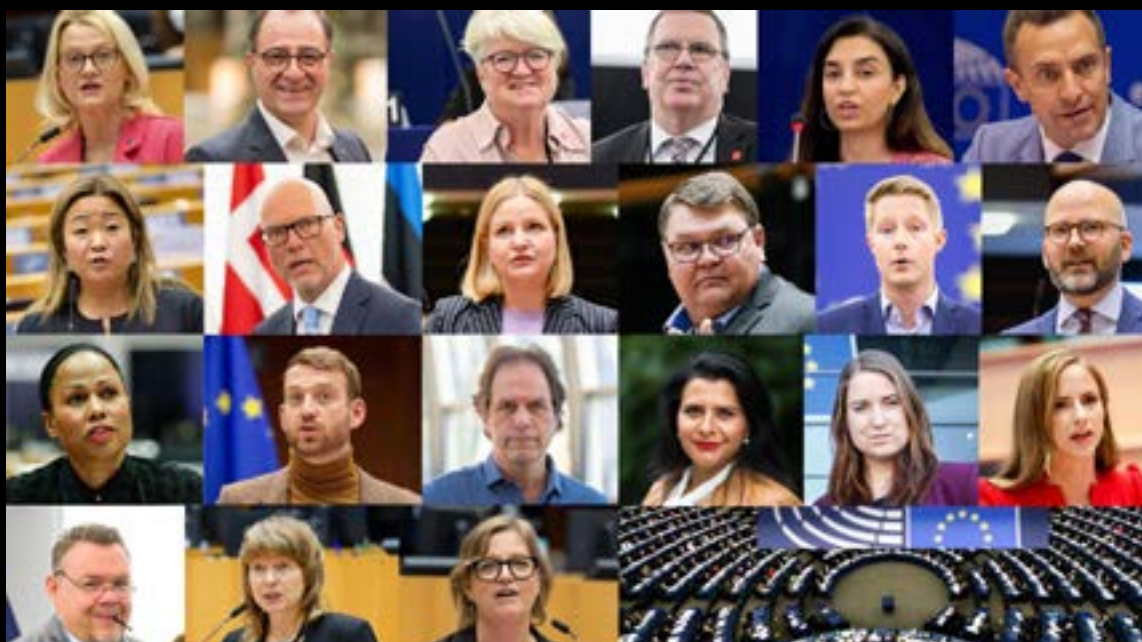
Översta raden: Heléne Fritzon (S), Ilan De Basso (S), Carina Ohlsson (S), Erik Bergkvist (S), Evin Incir (S), Tomas Tobé (M). Andra raden: Jessica Polfjärd (M), Jörgen Warborn (M), Arba Kokalari (M), Peter Lundgren (ex-SD), Johan Nissinen (SD), Charlie Weimers (SD). Tredje raden: Alice Bah Kuhnke (MP), Jakop Dalunde (MP), Pär Holmgren (MP), Abir Al-Sahlani (C), Emma Wiesner (C), Sara Skyttedal (KD). Fjärde raden: David Lega (KD), Malin Björk (V), Karin Karlsbro (L).